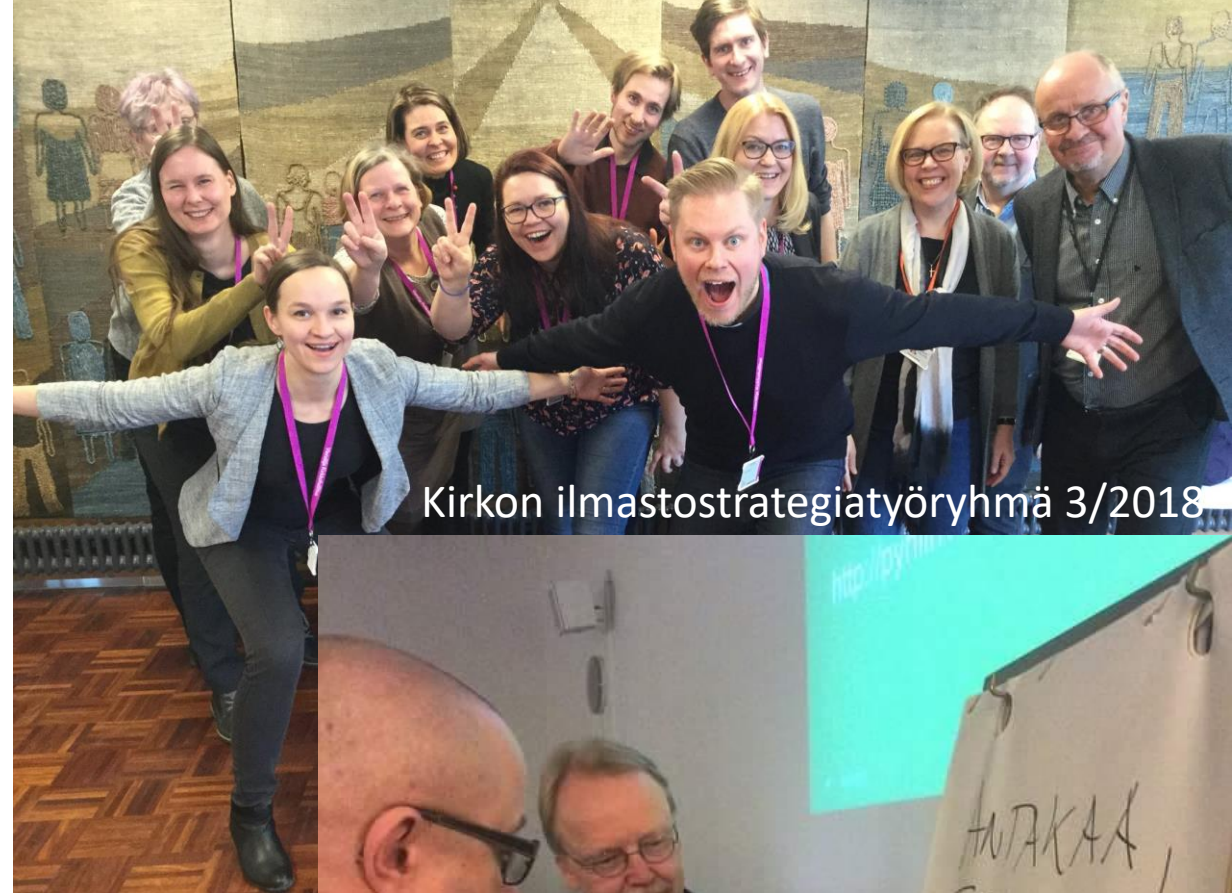
Kirkon ilmastostrategiatyöryhmä 3/2018